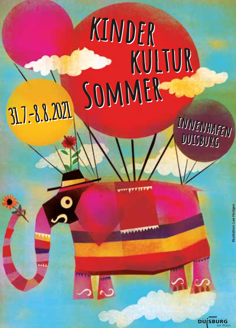
Illustration: Lee Hodges